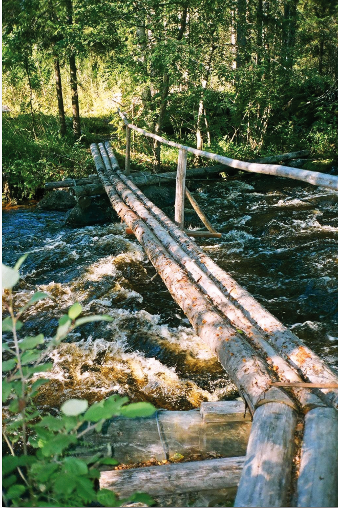
Bro över till Hemgravsån